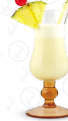
PIÑA COLADA 149,- Havana bílá, kokosový sirup, ananasový džus, smetana Havana añejo blanco, coconut syrup, pineapple juice, cream Белый ром Havana, кокосовый сироп, ананасовый сок, сливки