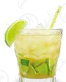
CAIPIRINHA 109,- Cachaca, limetka, třtinový cukr Cachaca, lime, cane sugar Cachaca, лайм, тростниковый сахар