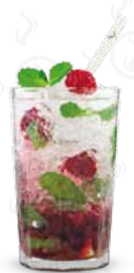
MOJITO MALINA 129,- Havana bílá, limetka, třtinový cukr, čerstvá máta, maliny, soda Havana añejo blanco, lime, cane sugar, fresh mint, raspberries, soda Белый ром Havana, лайм, тростниковый сахар, свежая мята, малина, сода