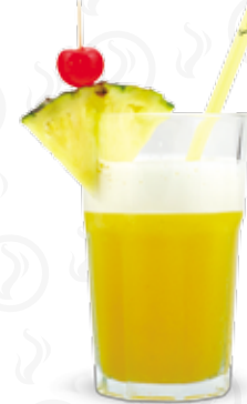
MAI TAI 199,- Havana bílá a tmavá, Triple sec, ananasový džus Havana añejo especial, Triple sec, pineapple juice Белый и чёрный ром Havana, Triple sec, ананасовый сок