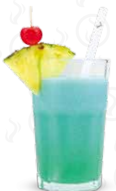
SWIMMING POOL 159,- Vodka, Blue curacao, kokosový sirup, smetana, ananasový džus Vodka, Blue curacao, coconut syrup, cream, pineapple juice Водка, Blue curacao, кокосовый сироп, сливки, ананасовый сок.