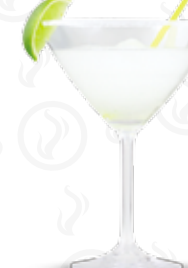
MARGARITA LIMETA 129,- Tequila, Cointreau, cukrový sirup, limetková šťáva Tequila, Cointreau, sugar syrup, lime juice Текила, Cointreau, сахарный сироп, сироп из лайма