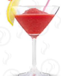
JAHODOVÉ DAIQUIRI 135,- Havana bílá, citrónová šťáva, jahody, třtinový cukr Havana añejo blanco, lemon juice, strawberries, cane sugar Белый ром Havana, лимонный сироп, клубника, тростниковый сахар