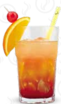
TEQUILA SUNRISE 99,- Tequila silver, pomerančový džus, Grenadina Tequila silver, orange juice, Grenadine Серебряная текила, апельсиновый сок, гренадин