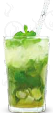
MOJITO 119,- Havana bílá, limetka, třtinový cukr, čerstvá máta, soda Havana añejo blanco, lime, cane sugar, fresh mint, soda Белый ром Havana, лимета, тростниковый сахар, свежая мята, сода