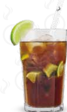
LONG ISLAND ICE TEA 219,- Gin Beefeater, vodka, tequila, Havana bílá, Cointreau, cola, cukrový sirup, citrónová šťáva, limetka Gin Beefeater, vodka, tequila, Havana añejo blanco, Cointreau, cola, sugar syrup, lemon juice, lime Джин Beefeater, водка, текила, белый ром Havana, Cointreau, кола, сахарный сироп, лимонный сок, лайм