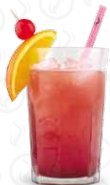
SEX ON THE BEACH 119,- Vodka, broskvový sirup, pomerančový a brusinkový džus, Grenadina Vodka, peach syrup, orange juice, cranberry juice, Grenadine Водка, персиковый сироп, апельсиновый и брусничный сок, гренадин