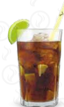
CUBA LIBRE 95,- Havana bílá, cola, limetka Havana añejo blanco, cola, lime Белый ром Havana, кола, лайм