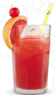
HIGH SOCIETY 179,- Gin Beefeater, grepový džus, Campari, broskvový sirup Gin Beefeater, greppfruit juice, Campari, peach syrup Джин Beefeater, грейфрутовый сок, Campari, персиковый сок