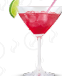
COSMOPOLITAN 109,- Vodka, Triple sec, brusinkový džus Vodka, Triple sec, cranberry juice Водка, Triple sec, брусниковый сок