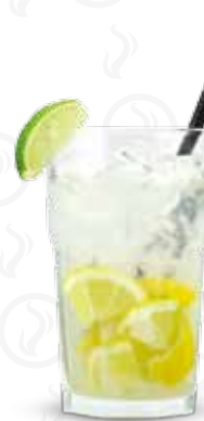
GIN FIZZ 99,- Gin Beefeater, citrónová šťáva, cukr, citrón, soda Gin Beefeater, lemon juice, sugar, lemon, soda Джин Beefeater, лимонный сок, сахар, лимон, сода