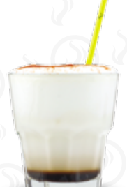
WHITE RUSSIAN 109,- Vodka, Kahlúa, smetana, skořice Vodka, Kahlúa, cream, cinnamon Водка, Kahlua, сливки, корица